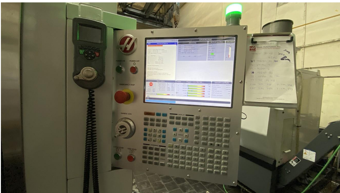
CNC ovládací panel stroje